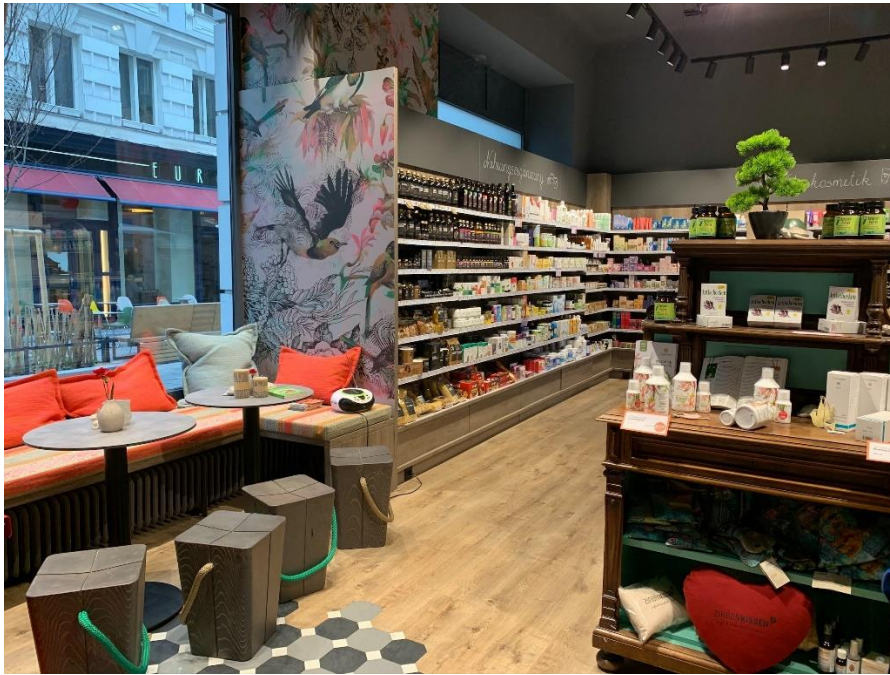
Filiale Innen mit Wohlfühlecke