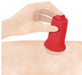
Beim Tipping wird der angesaugte Cup auf der Haut hin- und hergekippt, beim Circling in sich gedreht.

An der Kante des Cups entstehen so besondere Sogkräfte, die das Gewebe dort zusätzlich nach oben ziehen und dann wieder etwas entspannen lassen. Gleichzeitig fixiert man durch den Druck der gegenüberliegenden Cup-Seite das Gewebe. Das verstärkt die Sogwirkung und hilft zum Beispiel bei lokalen Beschwerden wie Narben oder Triggerpunkten, den Bereich gezielter anzusteuern. Nutzt man außerdem den Massageeffekt, wird durch die Aktivierung des Stoffwechsels der Heilungsprozess und die Gewebeneubildung verstärkt angeregt.