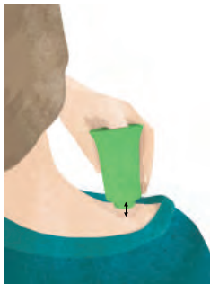
Tapping lockert Verspannungen durch Klopfen mit der Cup-Spitze.

Die Anwendungsbereiche des Klopfens reichen von der allgemeinen Wohlfühlmassage bis hin zu gezielter therapeutischer Massage, um Blockaden zu lösen und die körpereigenen Selbstheilungskräfte anzuregen. Tapping